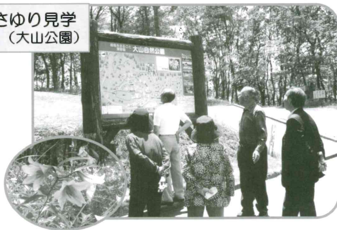
ひめさゆり見学 (大山公園)