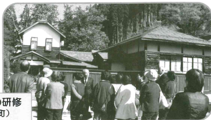
福祉推進員と民生委員の研修 (金山町)