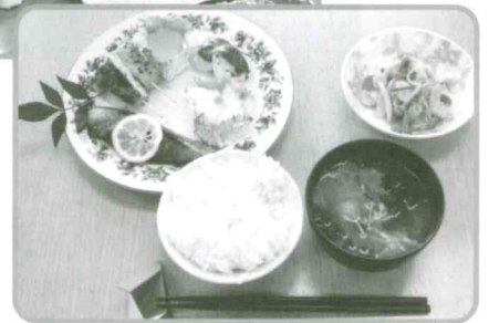
食改成生支部会員による 手作り弁当やおせち料理