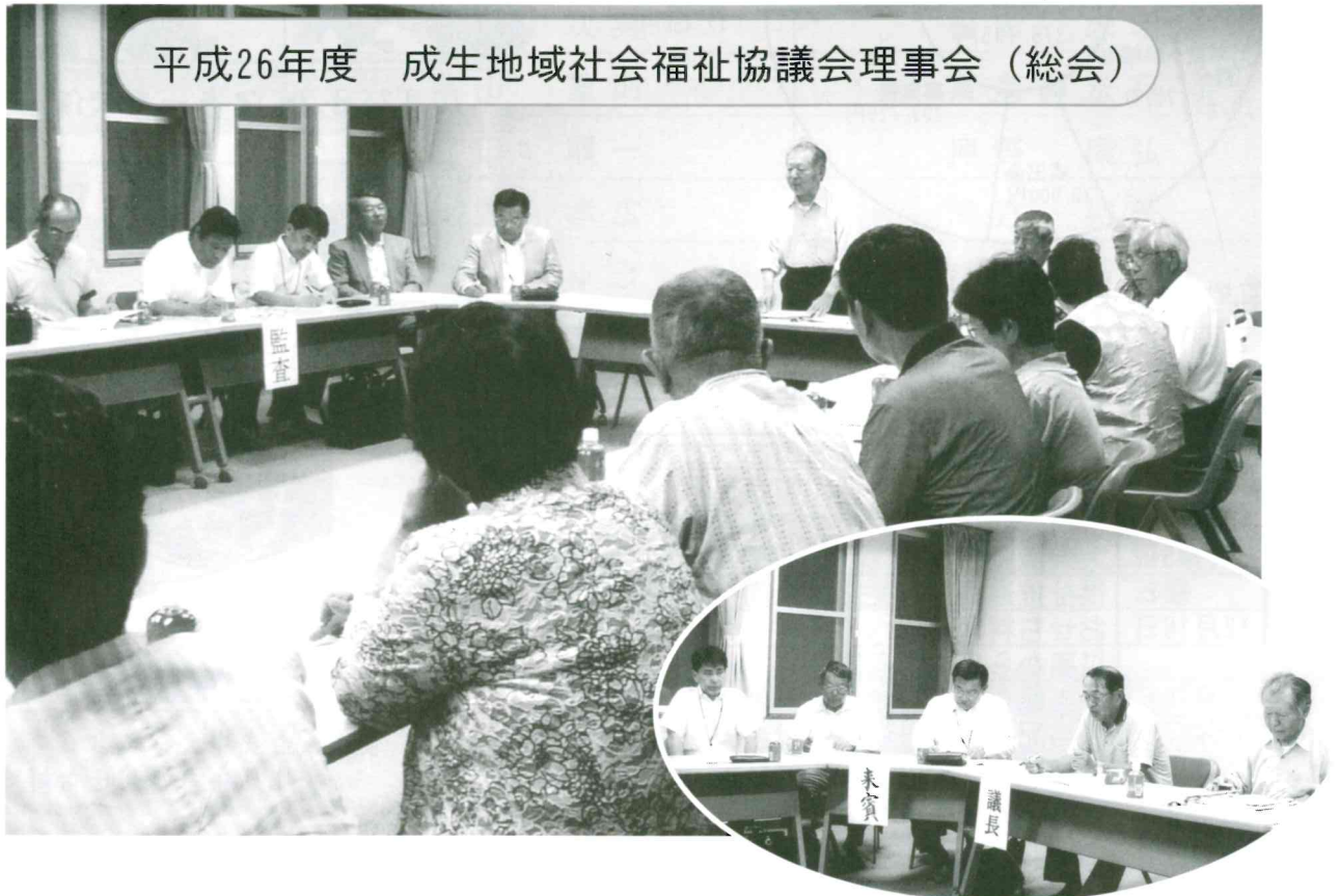
平成26年度 成生地域社会福祉協議会理事会（総会）